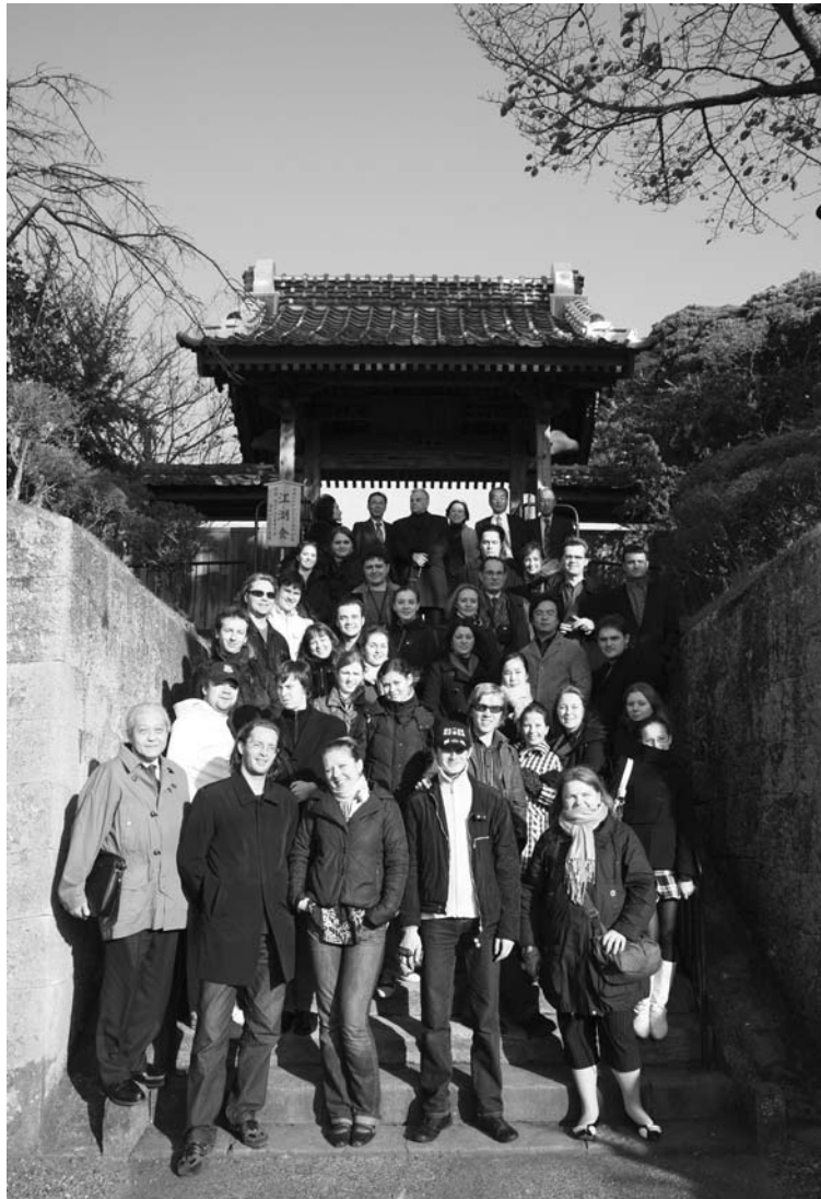
В Симодэ, где проходила религиозная церемония у могилы русских моряков

ковского и Рахманинова, духовные сочинения Глинки, Рим-