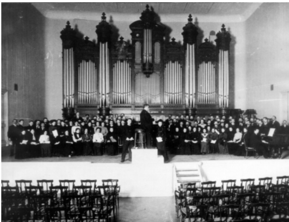
Репетиция концерта, посвященного открытию Большого зала Московской консерватории (за дирижерским пультом — В.И.Сафонов)

Необыкновенную целеустремленность, замечательный организаторский талант Василий Ильич, наверное, унаследовал от отца, сделавшего головокружительную карьеру, — от терского казака до генерала царской армии. Благодаря отцу вся семья с Кавказа переехала в Петербург, и юный Сафонов поступил в Александровский лицей, где некогда учился Пушкин. А затем, уже вопреки надеждам отца, мечтавшего видеть сына сановником, Сафонов стал студентом Петербургской консерватории, которую окончил с золотой медалью, начал преподавать в ней, но, подобно многим ее блестящим выпускникам, устремился в Москву и надолго связал свою судьбу со второй русской консерваторией.