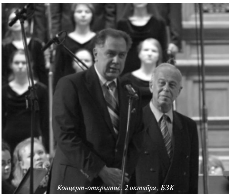
Концерт-открытие. 2 октября, БЗК

Московская консерватория вступила в свой юбилейный учебный год – ровно через 140 лет с исторического момента начала ее существования. Этот праздничный рубеж отметили своим приветствием и официальные лица страны, и сама консерватория – торжественной неделей музыки, звучавшей во всех консерваторских залах – Большом, Малом и Рахманиновском.