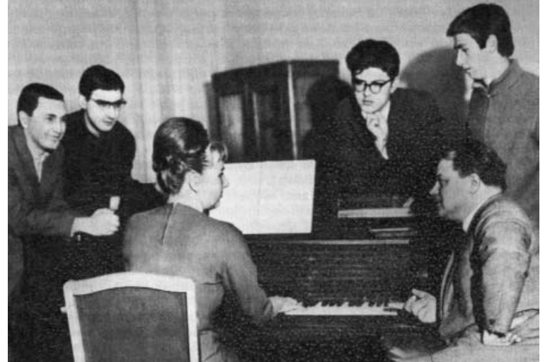
В консерваторском классе Т.Н. Хренникова

желательно. В результате все ученики проникались к нему доверием и искренней любовью. Со всеми проблемами — профессиональными, житейскими, человеческими — мы всегда обращались к нему как к старшему другу и неизменно получали сочувствие и добрую поддержку.