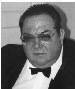
Народный артист СССР профессор Н.А.Петров

— Николай Арнольдович, поделитесь впечатлениями от прошедшего конкурса. Чем он Вас порадовал и чем огорчил?