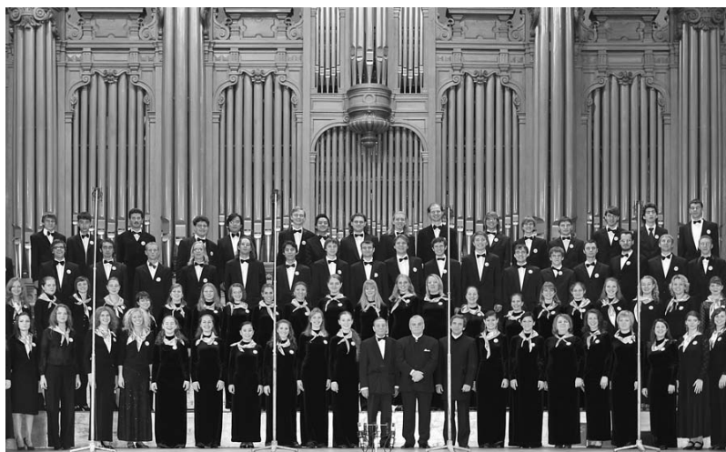
Концерт 29 октября.

быкновенно торжественный и величественный лад, чему способствовали не только духовный характер сочинений, уверенность и несуетность дирижерского жеста, но и звучание колоколов, помогавших слушателям переключаться из одного состояния в другое.