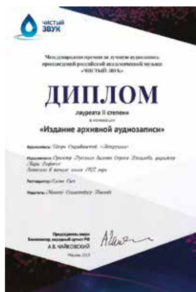
Диплом II степени