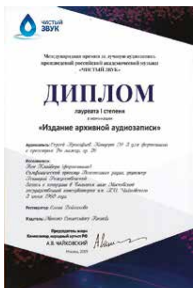
Диплом I степени

зам. зав. Центром звукозаписи и звукорежиссуры