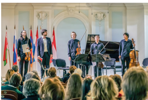
I премия – фортепианный квинтет МГК

Состязания камерных ансамблей обладают особой спецификой. Участники должны проявить не столько свое индивидуальное дарование (оно подразумевается само собой), сколько умение находиться в диалоге. Именно способность к сотворчеству, сопереживанию, сочувствию, соучастию и становится определяющей.