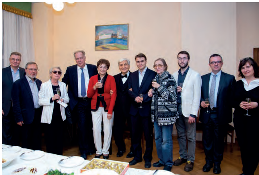
После премьеры.