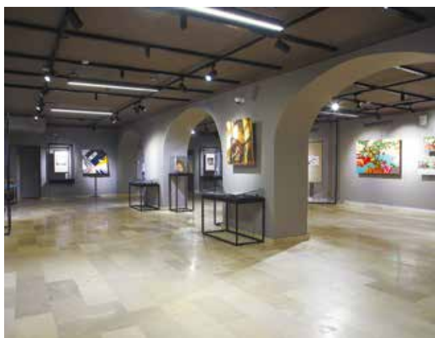
Выставочное пространство нижнего фойе Малого зала