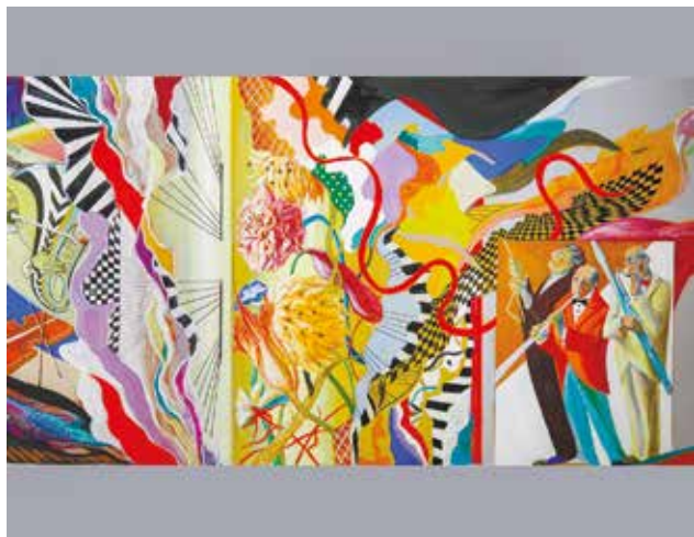
Олёна Бродина. «Дифония». Эскиз росписи