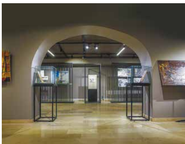
Выставочное пространство нижнего фойе Малого зала

Взаимодействие искусств в стенах Консерватории продолжается. Год назад было положено начало творческому партнерству Московской консерватории им. П.И. Чайковского и Московской художественно-промышленной академии им. С.Г. Строганова, когда 13 сентября, в торжественный день рождения Консерватории, впервые в нижнем фойе Малого зала открылась замечательная выставка студенческих работ. «Российский музыкант» рассказывал о ней своим читателям (РМ, 2019, №7), познакомив не только с новым выставочным пространством, возникшим в Консерватории, но и с его первым наполнением.