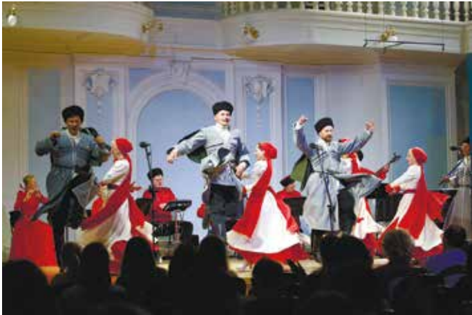
Ансамбль казачьей песни «Атаман» имени А.М. Красноперца

в «мертвый сезон», да еще такой жаркий можно было не ожидать. Но, как оказалось, тревога была напрасной: публики в зале было достаточно, и большим подспорьем оказались интернет-трансляции, собравшие огромную аудиторию. На ту пору ТВ Консерватории, замечательно показав в живом эфире концерты фестиваля «Россия – Вселенная звука», Международный конкурс Сергея Рахманинова и множество других консерваторских проектов, должно было, наконец, вздохнуть и набраться сил перед следующим сезоном. На помощь пришли давние друзья из компании LIVE GROUP, проведя трансляции всех концертов и сняв для истории все прочие события фестиваля.