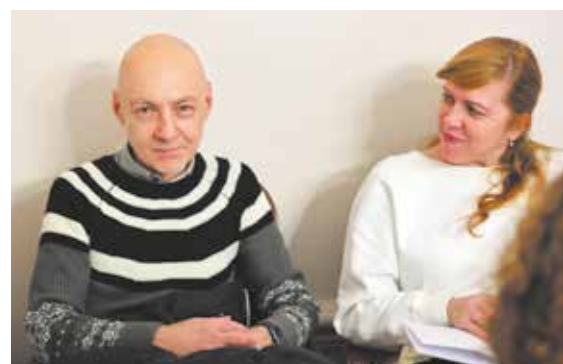
Главный художник Консерватории, автор верстки и дизайна С.А. Баронов