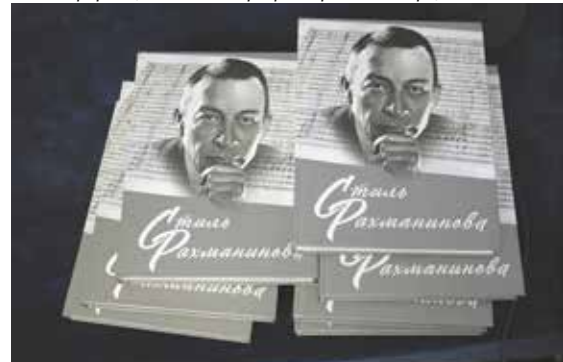
Обложка монографии «Стиль Рахманинова»