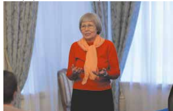
Выступление на презентации книги профессора Т.А. Старостиной