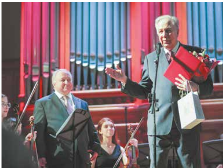
Поздравление ректора на юбилейном концерте в БЗК