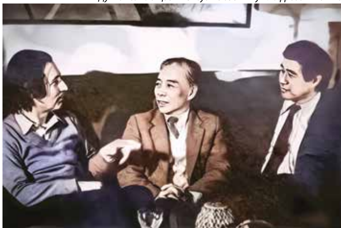
Ду Минсинь и Цзо Чжэнгуан в гостях у Альфреда Шнитке