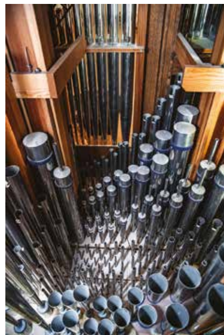
Часть вindleды I мануала Hauptwerk с трубами.