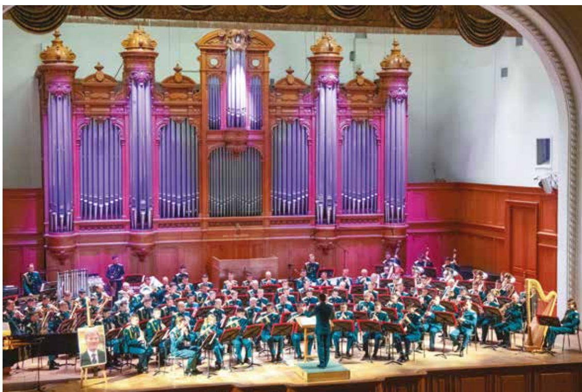
Центральный военный оркестр МО РФ