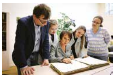
Архивисты за работой