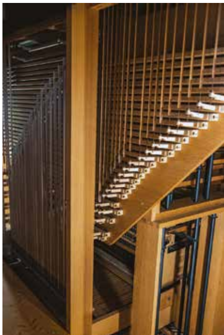
Трактуря органа под виндладой первого мануала

– Оказывается, большие и тяжелые металлические трубы могут быть при этом чрезвычайно уязвимыми и так легко испортить их звучание одним неосторожным движением. А почему не разрешают ходить внутрь органа и даже просто прикасаться к трубам?