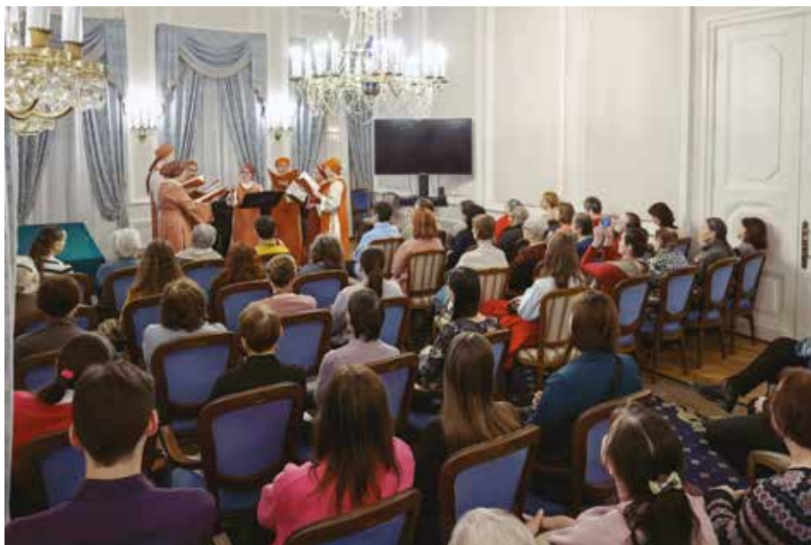
Выступление ансамбля «Асматикон».

– В интерактивном формате. Раймундо постоянно взаимодействовал со слушателями, вовлекал их в исполнение. Предварительно он дал справку о бытовании хора в современной практике, а затем сконцентрировался в основном на исполнительских аспектах, рассказы-